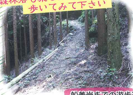
船着岩までの遊歩道